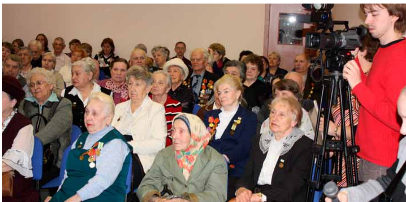
Презентация книги «Память сердца», том 5 в Доме детского творчества по адресу: пр. Мечникова, д. 2