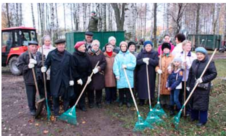
В апрельские дни Совет ветеранов и сотрудники МО Пискаре́вка проводят уборку братских захоронений на Пискаре́вском мемориале