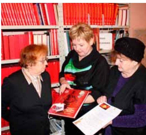
Библиотека Музея обороны Ленинграда пополнилась книгой «Память сердца», том 5