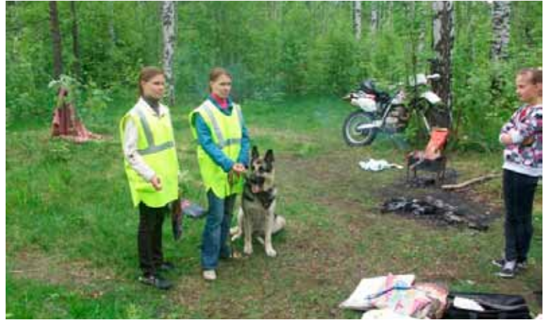
Рейды народной дружины совместно с сотрудниками полиции в Пискаревском лесопарке