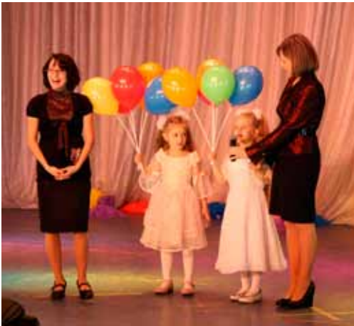
Фестиваль «Мы разные, но мы вместе!»