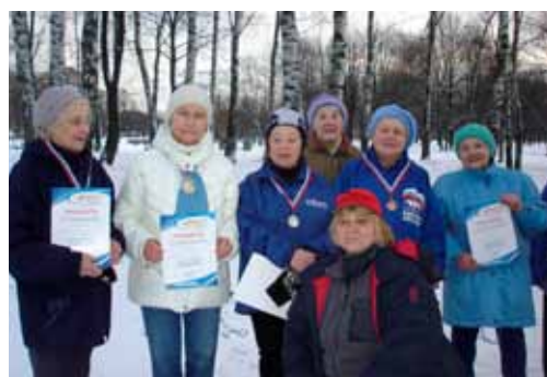
Регулярные занятия спортом подвигли членов группы здоровья принять участие в «Женской десятке»