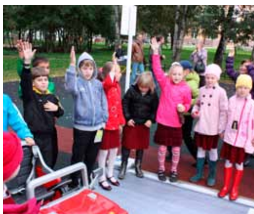
Занятия по безопасности дорожного движения