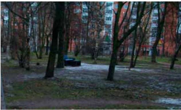
До проведения работ