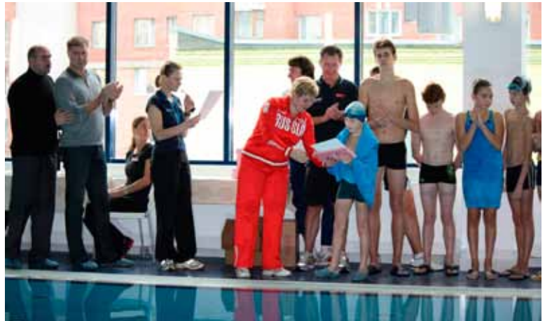
Заплыв, посвященный Дню матери. Спортклуб «Олимпик»