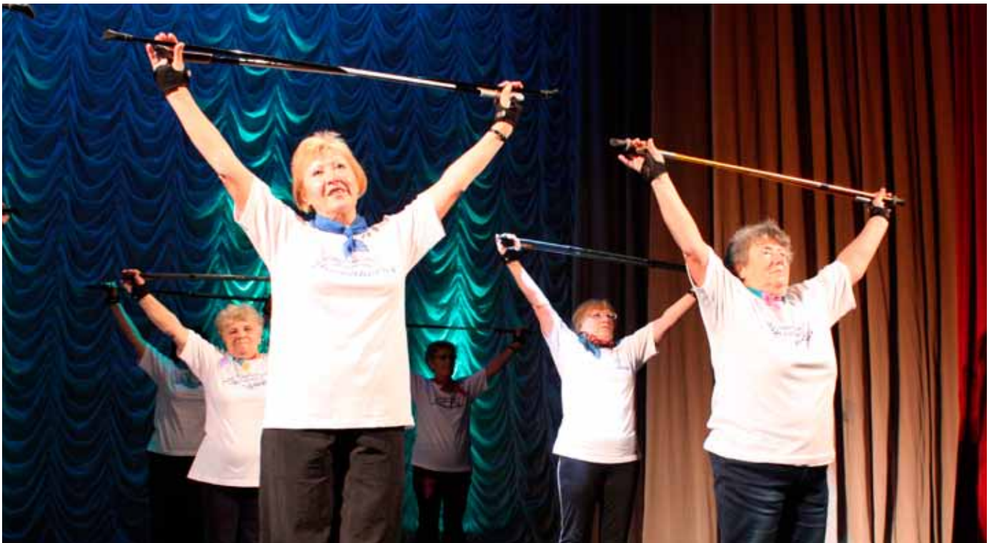
Девиз муниципального образования Пискаревка — «Движение — это жизнь!»