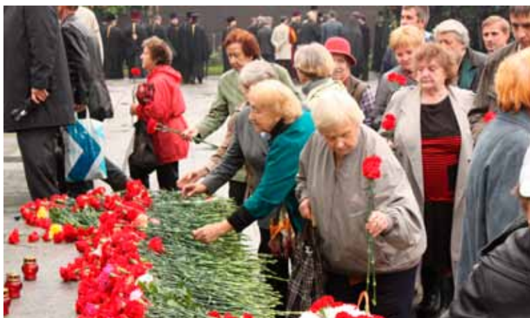
В памятные даты жители округа возлагают цветы на Пискаре́вском мемориальном кладбище