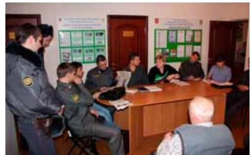
Встреча жителей округа с сотрудниками прокуратуры и правоохранительных органов Калининского района