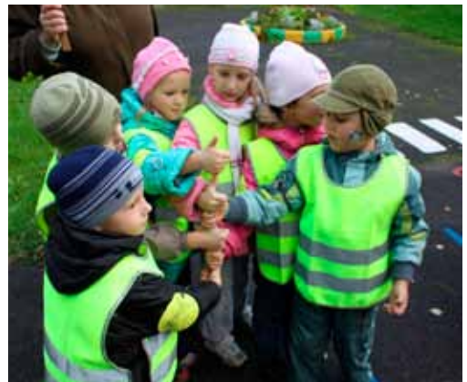
Умение работать в команде