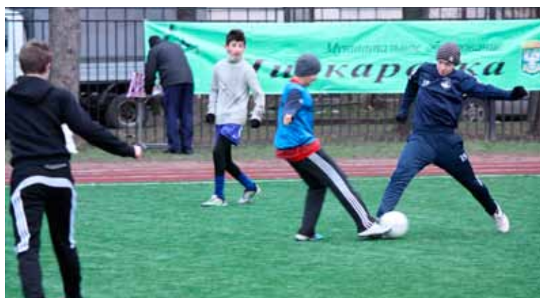
Турнир по мини-футболу «Кожаный мяч»