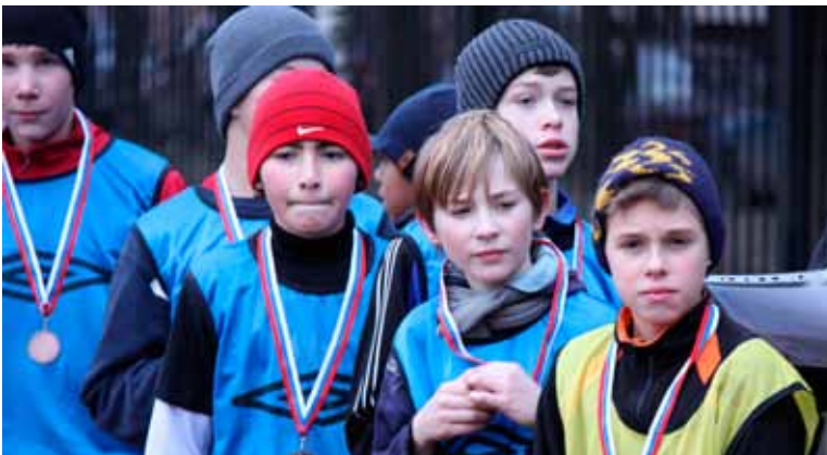
Победители турнира по мини-футболу «Кожаный мяч»