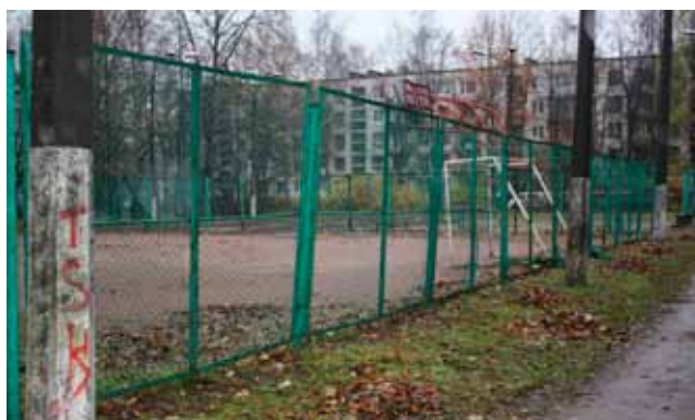
До проведения работ