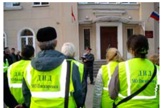
Смотр дружины МО Пискаревка