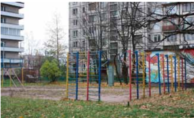
До проведения работ