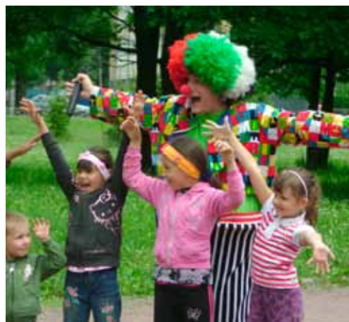
Летом в Пионерском парке в выходные дни детей встречали клоуны