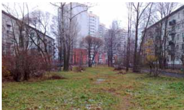
До проведения работ